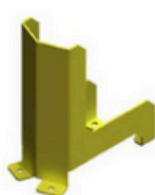
Sabot lisse basse