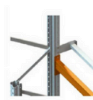
Butée à palette