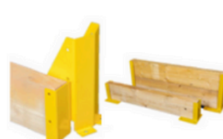
Protection latérale bastaing bois