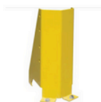
Sabot de protection