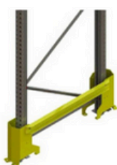
Protection latérale métallique (Sur demande)