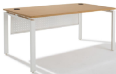
Voile de fond métallique